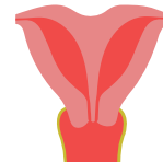
uterus bicornis bicollis: hartvormig, 2 baarmoederhalzen