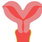
uterus bicornis unicollis: hartvormig, 1 baarmoederhals