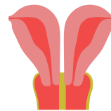
uterus didelphys: dubbele baarmoeder