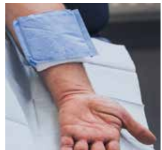
Non-woven kompres en absorberend verband