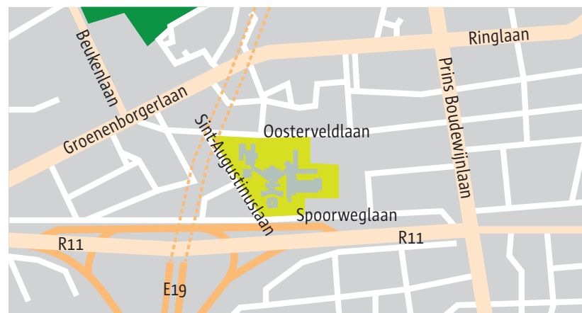
De ligging van campus Sint-Augustinus.