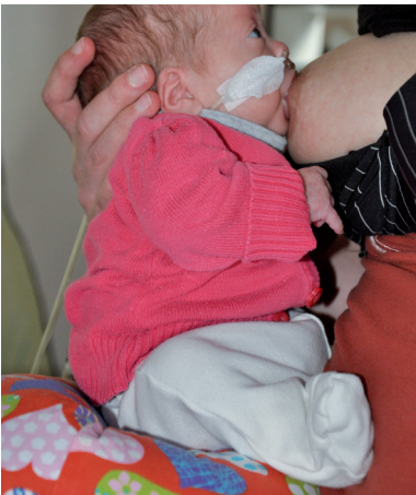
Al zittend je baby voeden