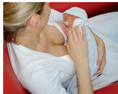
Madonna- of wiegenhouding

Een goede houding van zowel moeder als baby is erg belangrijk tijdens de borstvoeding. Als u niet comfortabel zit of uw baby is niet goed gepositioneerd, dan zal de borstvoeding niet vlot verlopen. U kunt uw baby op verschillende manieren aanleggen.