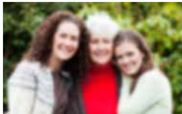
troebel zicht door cataract