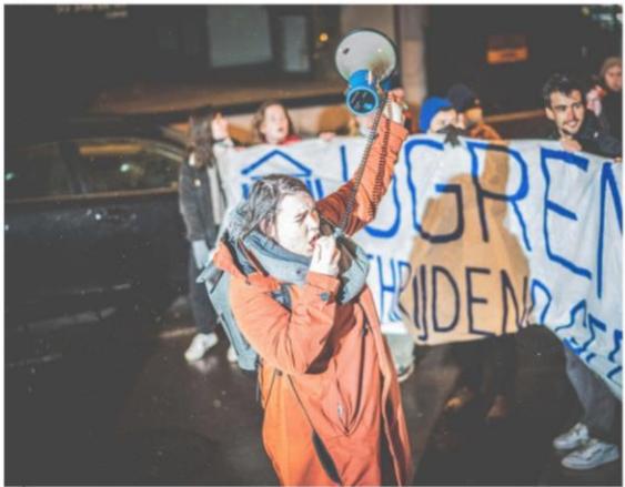
Een betoging in januari vorig jaar tegen seksueel grensoverschrijdend gedrag aan universiteit in Gent.