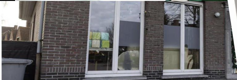
James Arthur Photography